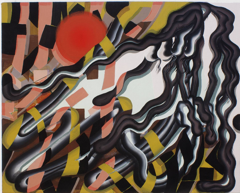
'Greater eclipse', obra de Bridget Mullen.